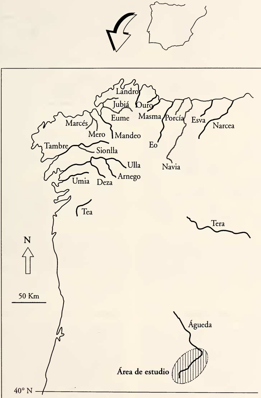
Figura 1. Mapa de distribución de M. margaritifera en España. En trazo gris los ríos en los que sólo existen referencias históricas o referencias pendientes de confirmación; en trazo negro los ríos donde se ha confirmado la presencia reciente de ejemplares vivos, incluyendo la situación del área de estudio.

Figure 1. Map showing the distribution of M. margaritifera in Spain. Gray line: historical references and unconfirmed records. Black line: confirmed records, including the study area.